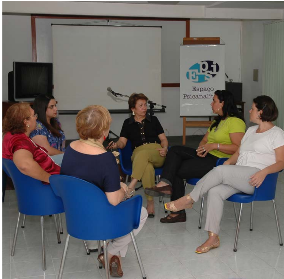
Profissionais do Espaço Psicanalítico durante uma de suas reuniões periódicas

As fundadoras marcaram uma posição extraída tomando, de certo modo, o que diz Guimarães Rosa, no seu monumento literário "Grande