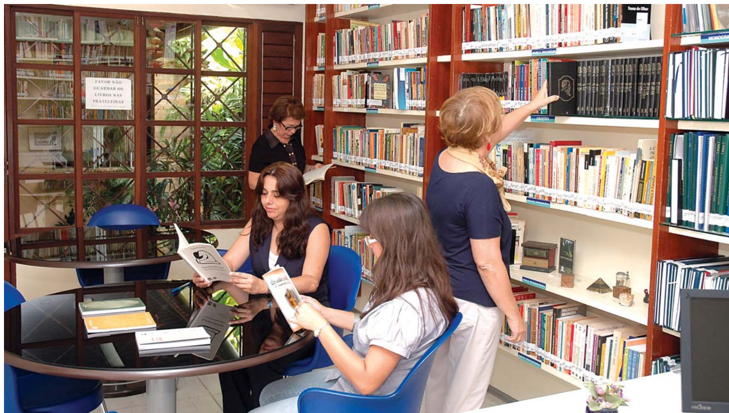
A Biblioteca do EPSI, com um acervo de importantes obras especializadas, é um local perfeito para leituras e pesquisas sobre psicanálise