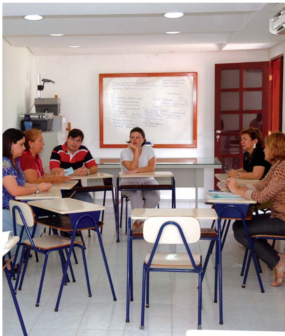
Nas salas de aula do EPSI gesta-se o pensamento que gera as futuras ações profissionais

Psicanálise - Teoria e Técnica: curso que contém um conjunto de atividades curriculares voltadas para o domínio e para o aprofundamento de conhecimentos teóricos e técnicos na área da Psicanálise. Integra, de