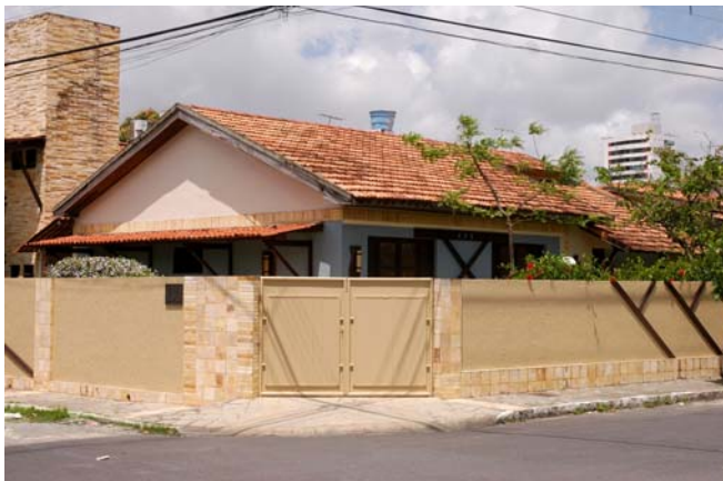
Sede do Espaço Psicanalítico, Estudos, Clínica e Consultoria

O EPSI tem se voltado para tentar responder algumas das questões do contexto social, mantendo reflexões e um compromisso de contribuir para a transformação deste mesmo contexto. "Montamos, juntamente com um grupo de psicólogos e psicanalistas uma organização tal que hoje se tornou uma instituição reconhecida no âmbito nacional". Neste sentido, comemoram as fundadoras, acrescentando que uma das mais importantes revistas na área de psicanálise - a Revista Pulsional - dedicou uma de suas edições ao EPSI. "É uma prova de que nós investimos muito seriamente no que fazemos, contribuindo para que a psicanálise possa avançar". O endereço do EPSI é Rua Nevinha Cavalcanti, 46 - bairro Miramar, CEP:58043-000 - João Pessoa. Sua infraestrutura inclui diretoria, gerência, coordenação de cursos, biblioteca, consultórios, sala multiuso, sala de