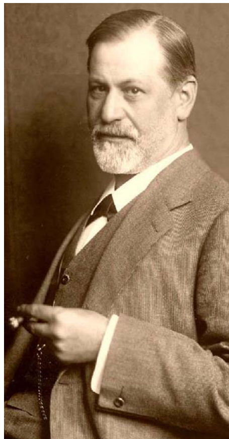
Dr. Sigmund Freud, o "pai da psicanálise"

Sertão Veredas": "Pergunto coisas ao Buriti: e ao que ele responde é: a coragem minha. Buriti quer todo o azul e não se aparta de sua água - carece de espelho". Desta forma, consolidou-se o EPSI: com a coragem de suas fundadoras, sem se apartarem, como o Buriti de suas águas: dos ideais, do Sertão nordestino que sempre reclamou da aridez do seu solo, da falta de cuidado da nossa gente sofrida, marca sempre pelas diferenças sociais.